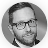
Sascha Pessinger Individualarbeitsrecht Richter am Bundesarbeitsgericht